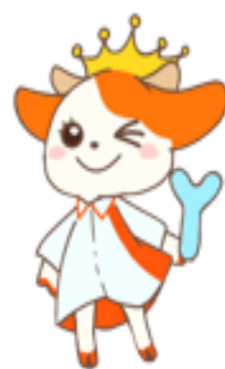
公式キャラクター さぼこ先生

森永乳業グループ 「健幸サポート栄養士」とは・・・ 森永乳業グループの栄養士の中でも 厳しい研修を受けた 特別な栄養士 です 健康に関するさまざまな情報を わかりやすくお届けします